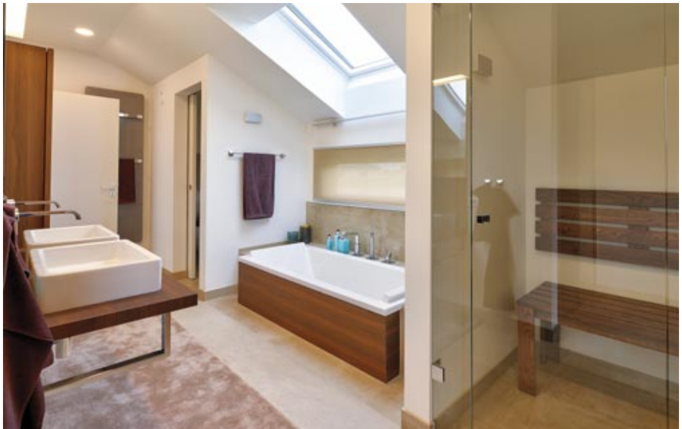
Mehr Komfort gibt es auch im Fünf-Sterne-Hotel nicht: Das Badezimmer punktet mit Dusche, Wanne, abgeteiltem WC und einer Sauna.