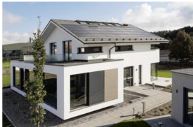
So schön kann Sonnenstrom sein: Die Photovoltaikanlage erzeugt zuverlässig Energie und fügt sich optisch harmonisch ins Dach ein.