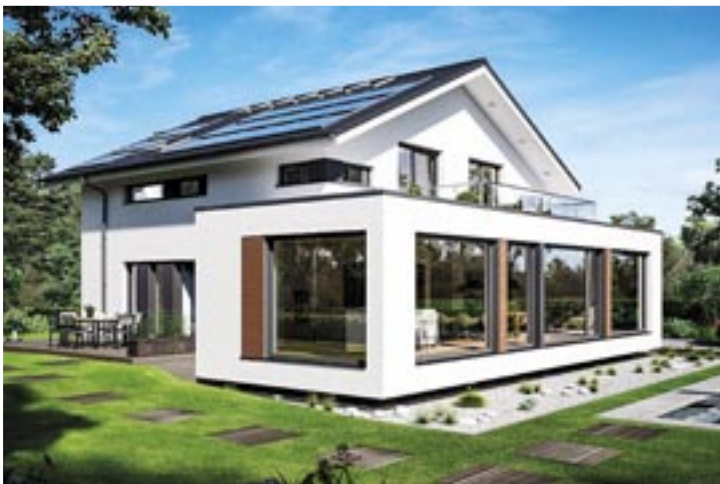
Glashaus: Der Flachdach-Anbau mit seinen üppigen Glasflächen beherbergt den über 80 Quadratmeter großen Wohnbereich mit offener Küche.